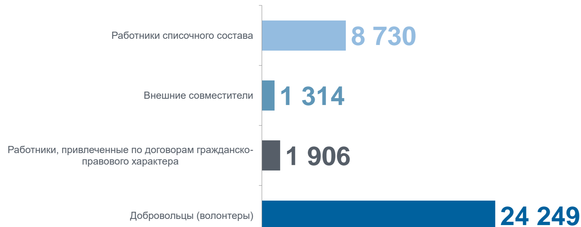
Участники деятельности организаций, чел.